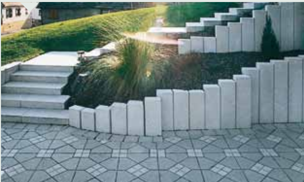
Schick in langer Reihe.